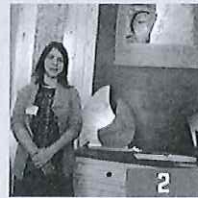
AUVELAIS Les enduits de Claire

j'ai demandé à mon filleul de prendre la pause dans la même posture. J'ai ainsi pu reconstituer la jambe manquante, explique-t-elle. J'ai fait de même pour la bouche de l'enfant Jésus sur l'autre tableau (NDLR Le baptême de Jésus ). C'est la fille de mon filleul qui m'a servi de modèle. » ■ B.I.