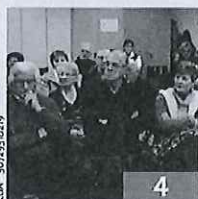
TAMINES La Croix-Rouge fête ses bénévoles