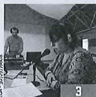
SOMBREFFE Les 35 ans de Radio Quartz