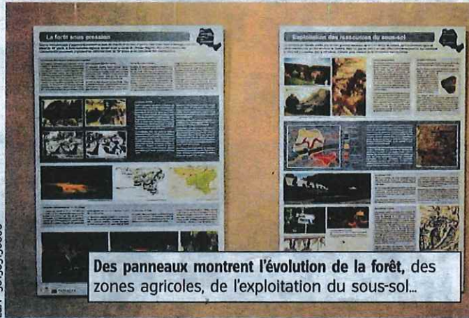
Des panneaux montrent l'évolution de la forêt, des zones agricoles, de l'exploitation du sous-sol...

Il y a un an, une exposition fut ainsi présentée au moulin-brasserie de Floreffe. Une série de panneaux, ainsi que de remarquables photos panoramiques réalisées par Jean-Claude Leroy évoquaient le développement